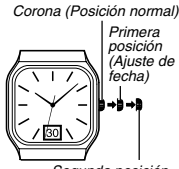
Corona (Posición normal)